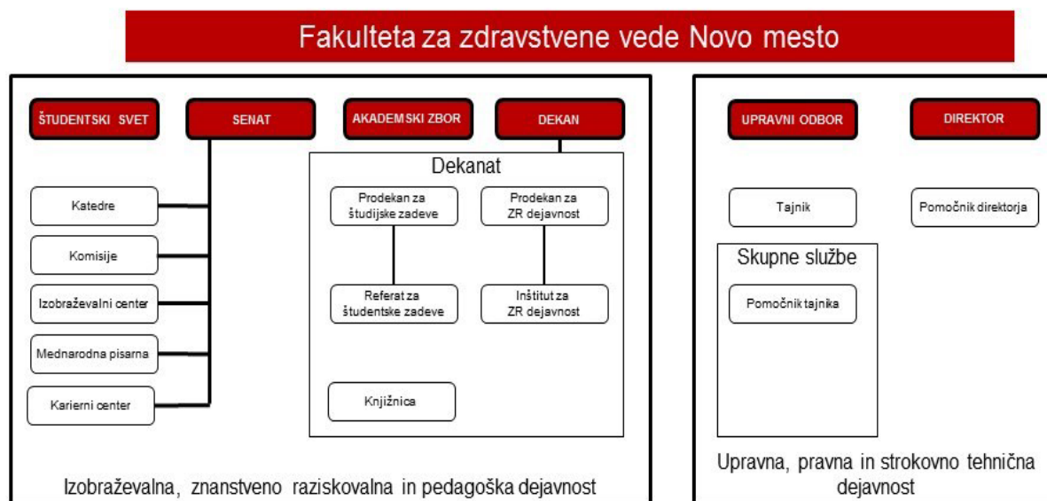
Slika 1: Organizacijska struktura fakultete

Za opravljanje pravnih, upravnih, administrativnih in strokovno tehničnih nalog ima fakulteta upravo. Naloge uprave izvajajo skupne službe , katerih delo koordinira in vodi tajnik fakultete.